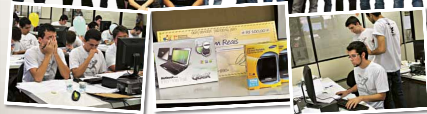
Os organizadores (no alto) e os alunos durante a competição