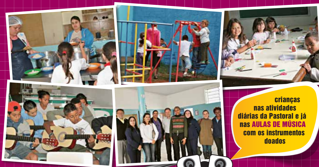
crianças nas atividades diárias da Pastoral e já nas AULAS DE MÚSICA com os instrumentos doados

Nas três unidades da Pastoral atendidas pela premiação do ConSePS o número total de crianças é superior a 900. Na cidade, o início desse trabalho se deu em 2002, com 50 crianças. Desde então são recebidas