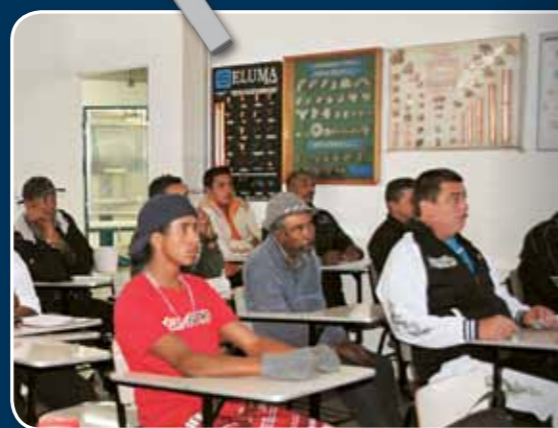
Os trabalhadores do Instituto Coopereso assistem à última aula do curso, antes de receberem seus certificados

Atualmente a Cooperativa trabalha em média com 120 cooperados, entre egressos e familiares que cuidam da manutenção e conservação do meio ambiente, tais como: manutenção e construção de calçadas em vias públicas, manutenção e sepultamento em cemitérios, limpeza e conservação de praças, plantio de árvores, usina para reciclagem de materiais de construção e adubo de compostagem, entre outros.