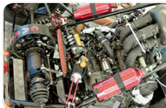
O carro em competição em 2010 e, no detalhe, o resultado do trabalho da equipe