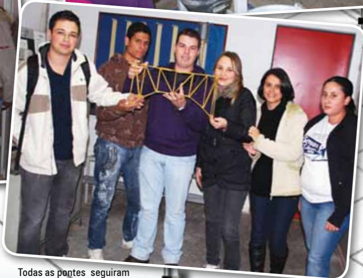
Todas as pontes seguiram uma especificação