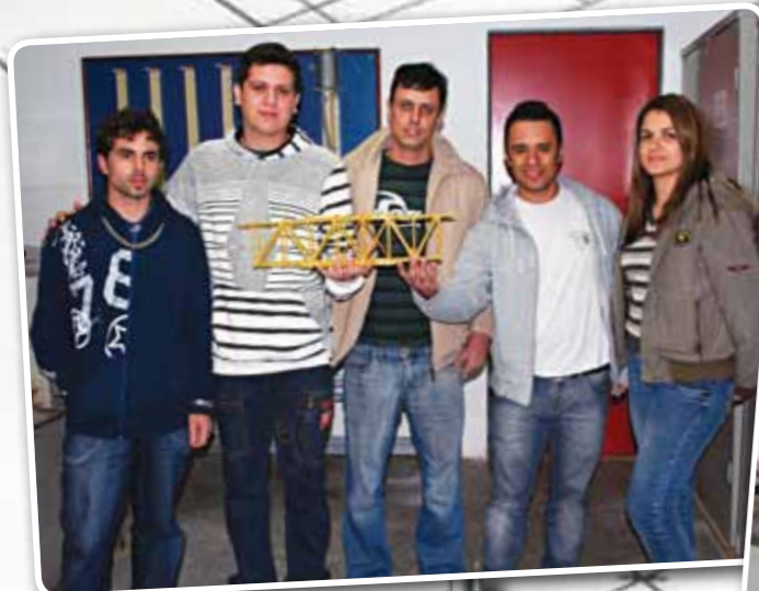
Alunos exibem sua obra-prima