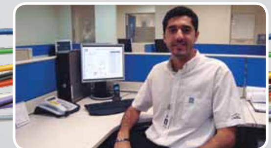
Ex-aluno começou na ZF com 17 anos