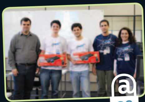
Dormindo na rede