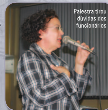
Palestra tirou dúvidas dos funcionários