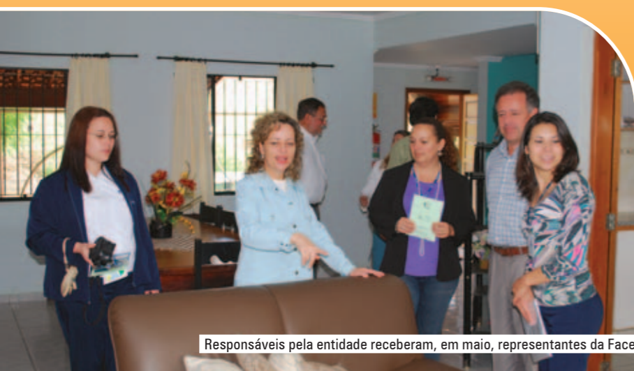
Responsáveis pela entidade receberam, em maio, representantes da Facens