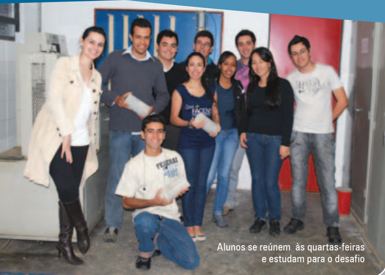
Alunos se reúnem às quartas-feiras e estudam para o desafio