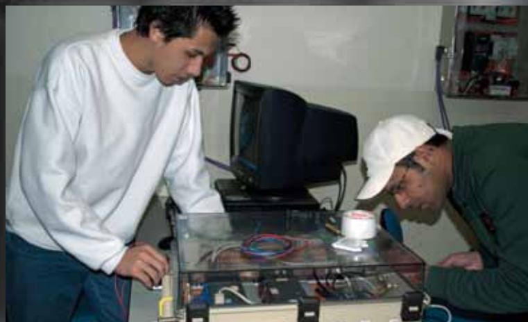
O curso CLP Siemens abrirá uma nova turma em setembro