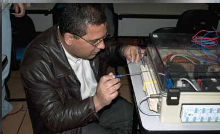
CLP Siemens atraiu pessoas que buscavam aprimoramento