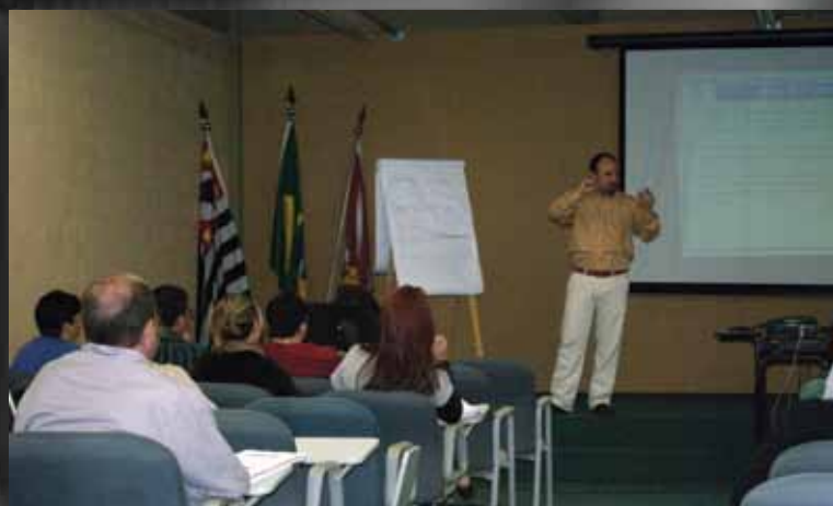
Participantes aprovaram o curso de extensão Seis Sigma

A constante busca pelo aperfeiçoamento dos alunos e da comunidade faz com que a Faculdade ofereça cursos de especialização que são tendências no mercado profissional. Em junho e julho, dois temas foram destaque no que se refere à extensão: Seis Sigma e CLP Siemens.