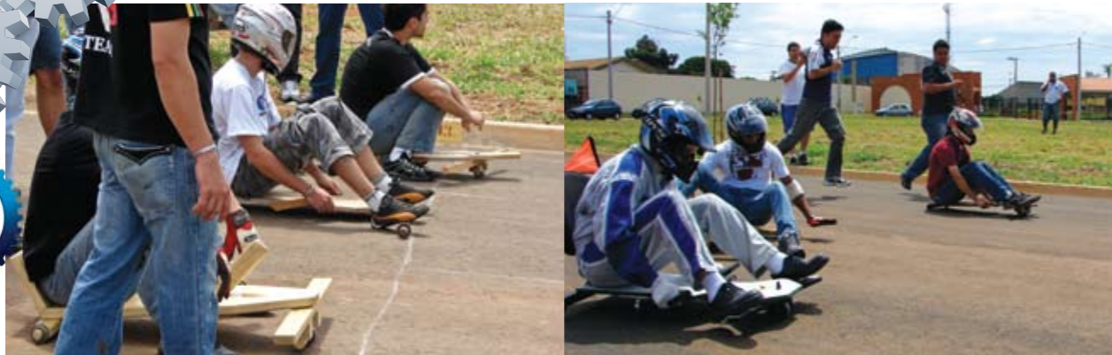
Os alunos participaram da Semana Global de Empreendedorismo no movimento 'bota pra fazer' – evento que ocorreu em todo o país

» A conclusão das matérias de Economia e Administração - curso de Engenharia Mecânica - provou que as disciplinas podem ser desenvolvidas de maneira bem lúdica. Desta vez, 39 alunos produziram carrinhos de rolimã e mostraram que criatividade, Economia e Administração podem ser parceiras.