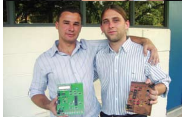
Alunos demonstram comprometimento a cada ano