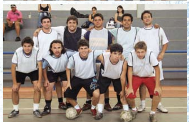
A final do 7º torneio aconteceu em 6 de dezembro