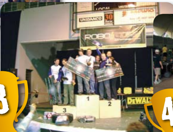
7º ENECA 2007 Encontro Nacional de Engenharia de Controle e Automação - Recife - PE 4º Colocado