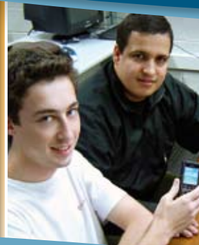
Tabela Periódica Interativa elaborada por aluno...pág.03

Ex-aluna conquista seu espaço .....pág.07