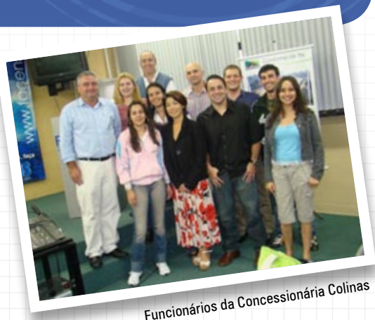
Funcionários da Concessionária Colinas

A aceitação dos alunos com relação às aulas extracurriculares foi tão grande que o próximo assunto, programado para o mês de agosto, já está definido: Barragens.