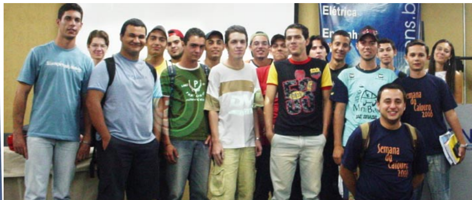
Calouros da Mecânica integrantes do Grupo de Atividades