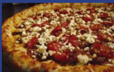
1ª noite da Pizza pág. 02