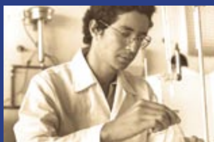
FACENS 30 anos: conheça os cursos págs. 04 e 05