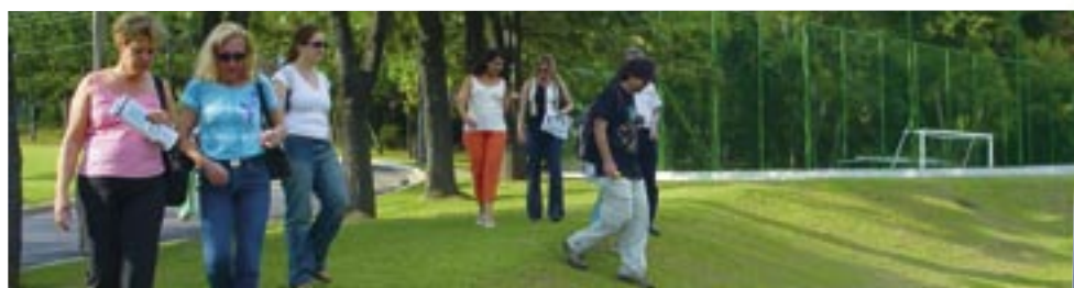
Professores da UFSCar visitam o campus da FACENS

As atividades acadêmicas em Sorocaba têm início ainda este mês. Alunos, professores e funcionários da UFSCar sejam bem-vindos!