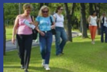
UFSCar já está no Campus da Faculdade pág. 07