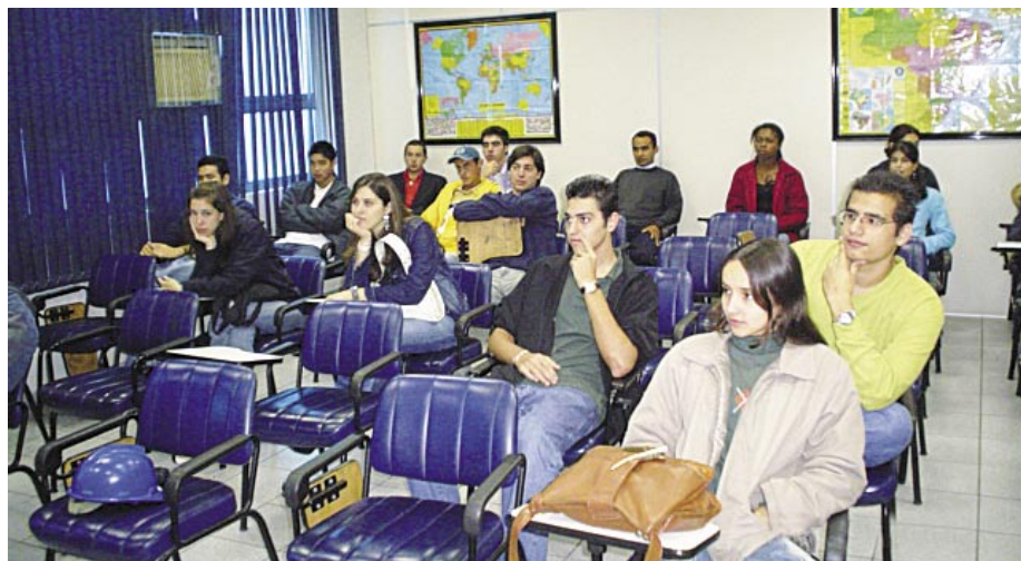
Alunos da Faculdade assistem palestra de apresentação da CBA.

Embora o nome Companhia Brasileira de Alumínio já indique a especialidade da empresa, alunos do primeiro ano integral de Engenharia Civil puderam constatar o que, até então, só conheciam em teoria.