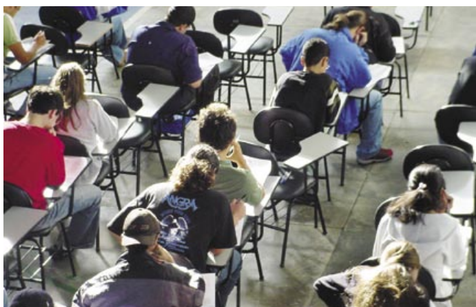
Muita concentração durante a prova.