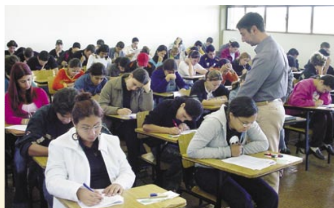
Um dos voluntários da FACENS monitora a sala.

Embora o papel das universidades seja um tema contundente e há muito venha sendo discutido, uma coisa é certa: as instituições de ensino devem estabelecer um efetivo compromisso com a solução dos problemas e desafios impostos pelo contexto social da sua comunidade.