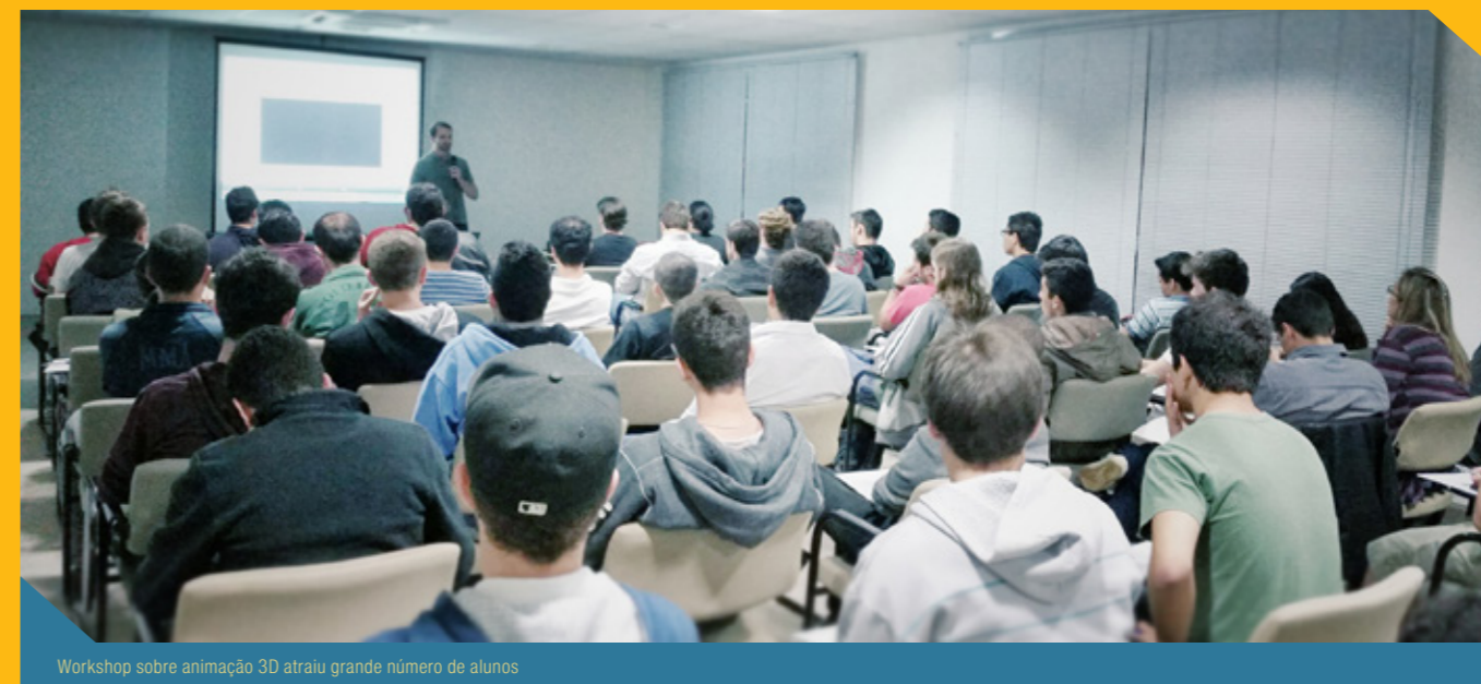
Workshop sobre animação 3D atraiu grande número de alunos

Os alunos da FACENS vão muito além da sala de aula. Neste último mês, além de visitas técnicas, os estudantes também aprimoraram seu conhecimento com um workshop. Aqui há Engenharia por vários meios: