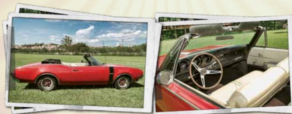
Ampla e confortável, o modelo conversível foi sucesso na época, principalmente aos amantes dos muscle cars , entre os quais o Oldsmobile foi um dos modelos mais cultuados

O modelo da reportagem é um Olds 442 1968, conversível. Sua cor vermelha, com faixa preta, é a mais clássica da categoria. Possui itens desportivos, sendo assim, provavelmente o único modelo com essas características rodando no país.