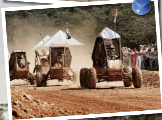
Acima a equipe responsável pelo Baja SAE que representa a FACENS; e as equipes competindo em uma das provas

Baja SAE Brasil – PETROBRAS 2012 – de 22 a 25 de março Local: em Piracicaba/SP